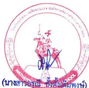
(นางสาวอรุณี ชั่งตั้งเต็มพงษ์) หัวหน้าเจ้าหน้าที่