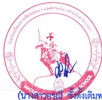
(นางสาวอรุณี ชั่งตั้งเต็มพงษ์) หัวหน้าเจ้าหน้าที่

** เอกสารฉบับนี้จัดพิมพ์โดยระบบอิเล็กทรอนิกส์ **